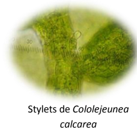
Stylets de Cololejeunea calcarea