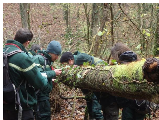
Observations bryologiques sur un tronc d'arbre mort