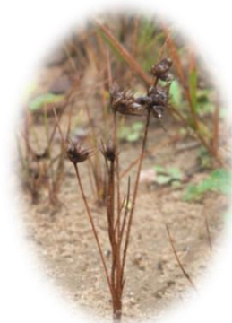
Juncus capitatus en fruits

Il est à noter que compte-tenu du trop grand nombre de stations à mettre à jour, le Jardin Botanique Jean-Marie Pelt a été mis à contribution dans le cadre de ces bilans stationnels, ils ont eu en charge la visite des stations de Carex hordeistichos , Senecio sarracenicus et Viola elatior .