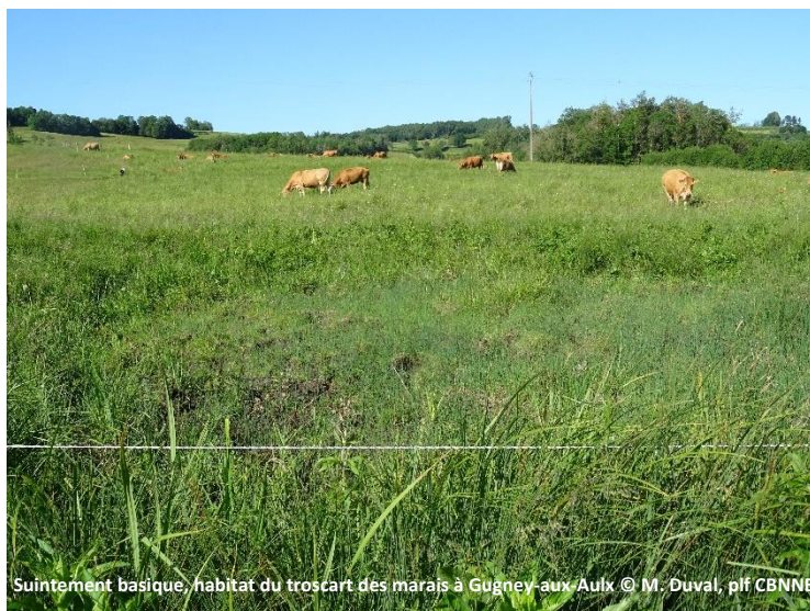
Suintement basique, habitat du troscart des marais à Gugney-aux-Aulx