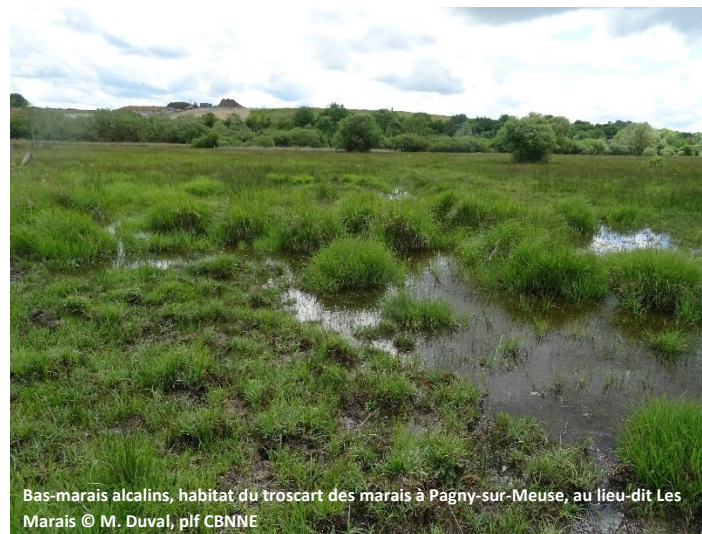
Bas-marais alcalins, habitat du troscart des marais à Pagny-sur-Meuse, au lieu-dit Les Marais