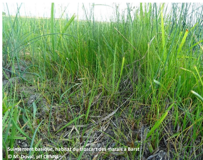
Suintement basique, habitat du troscart des marais à Barst