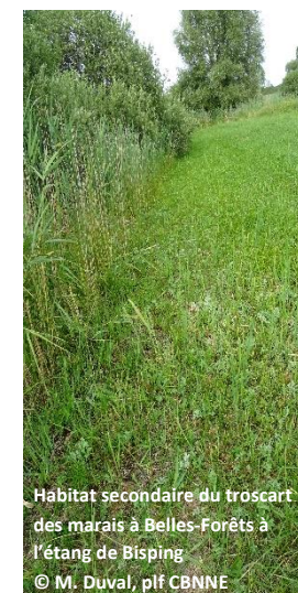
Habitat secondaire du troscart des marais à Belles-Forêts à l'étang de Bisping