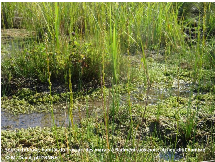
Source ruisselée, habitat du troscart des marais à Badménéil-aux-bois, au lieu-dit Chambre