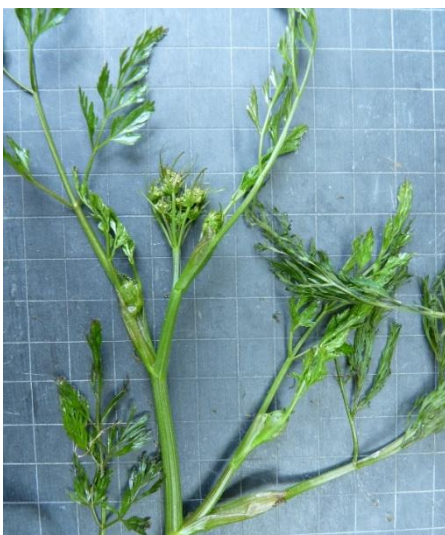
Oenanthe fluviatilis en début de floraison, Jean-Marie Weiss (Floraine), 2009

Elle se distingue difficilement d' Oenanthe aquatica dont elle n'a été séparée qu'au début du XX e siècle (Fernex & Fichot, 2014). L'œnanthe des rivières s'en différencie par son port flottant qui est dressé chez l'œnanthe aquatique (Fernex & Fichot, 2014). Les fruits sont également plus grands chez l'œnanthe des rivières, plus de 5 mm contre moins de 5 mm chez l'œnanthe aquatique (Tison et al. , 2014).