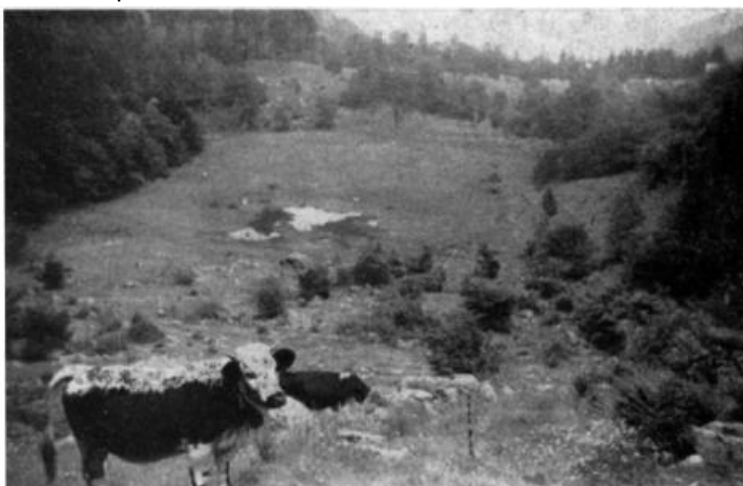
Cirque du Frankenthal

La cause de cette disparition est difficile à certifier, mais l'atterrissement de la tourbière de l'Etang Noir semble primer.