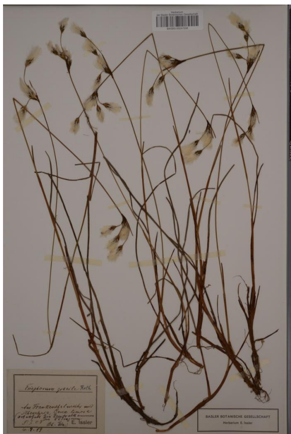
Planche d'herbier d' Eriophorum gracile au Frankenthal, réalisée par E. Issler.