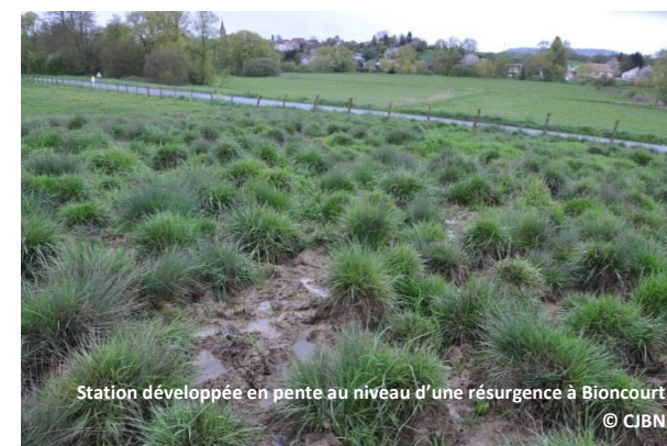
Station développée en pente au niveau d'une résurgence à Bioncourt