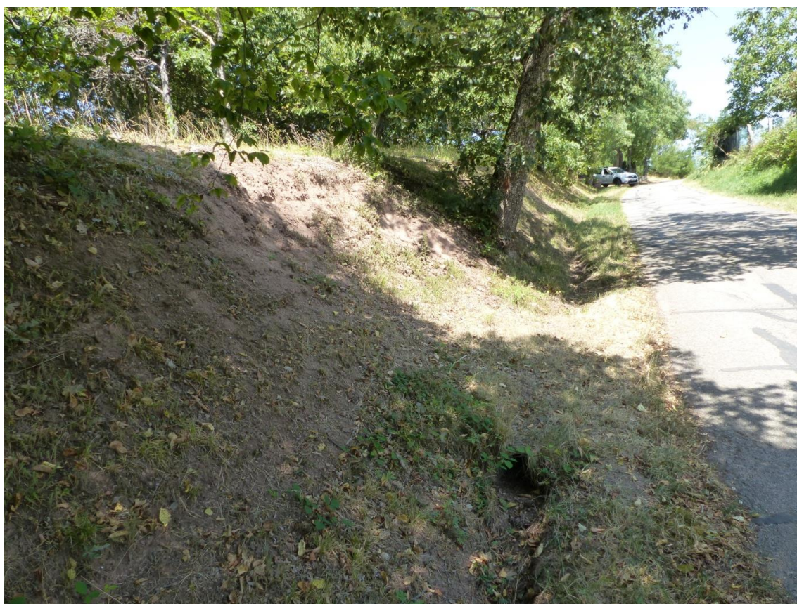
Figure 3 : Zone de présence de l'Orpin paniculé à Leimbach (68)