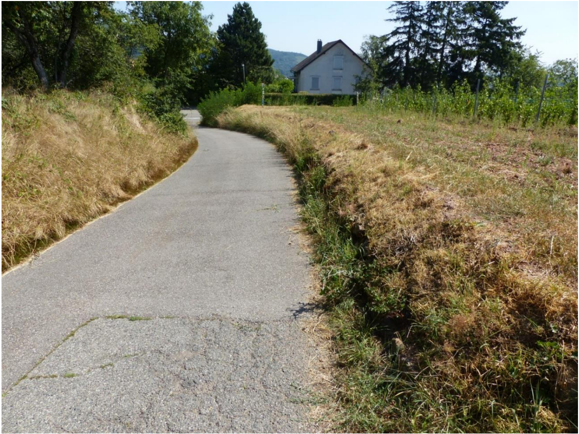
Figure 4 : Zone de présence de l'Orpin paniculé à Thann (68)