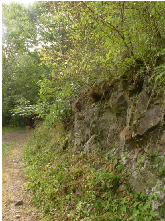
Figure 2 : Zone de présence de l'Orpin paniculé au Lilsbach (Andlau – 67)