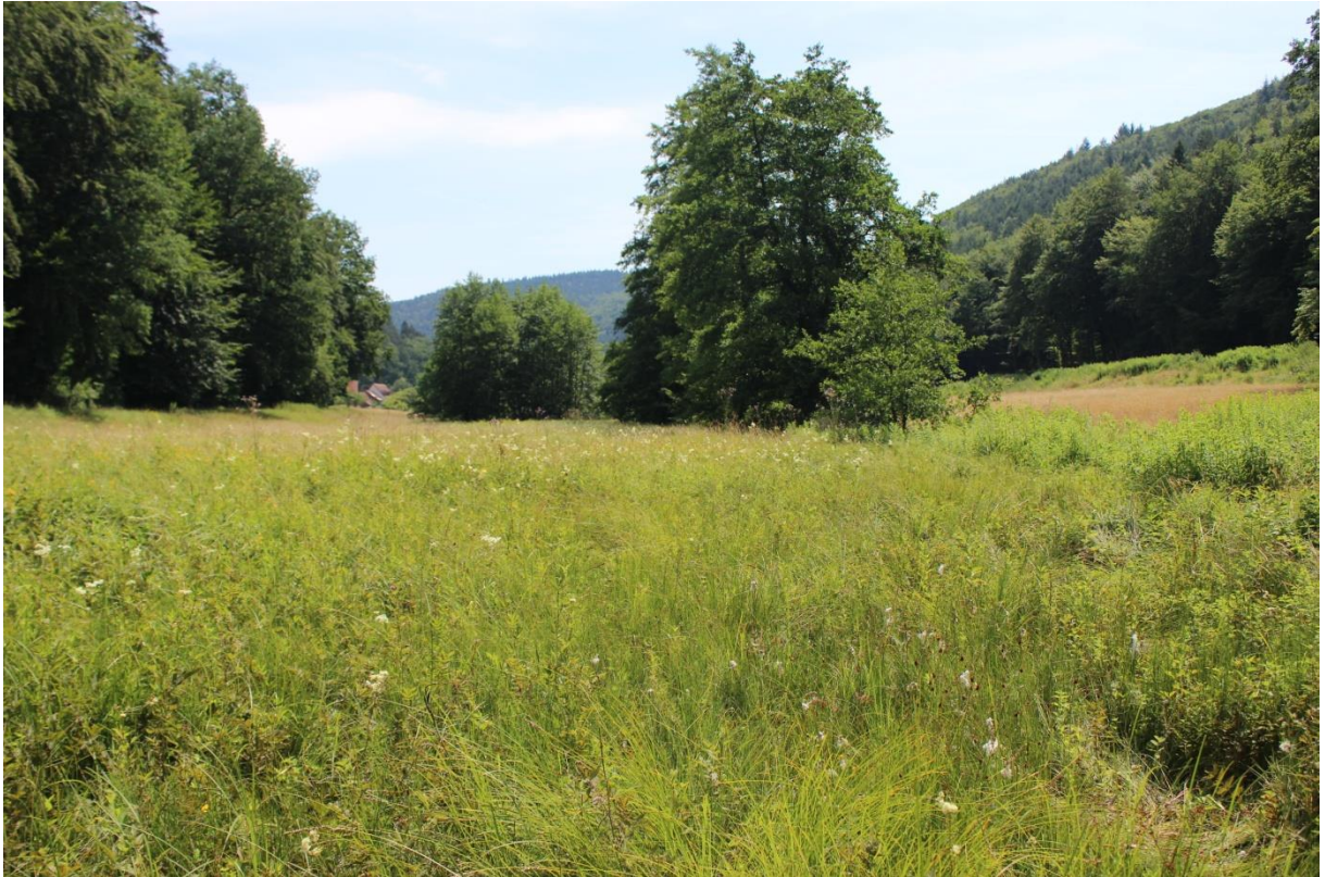
Figure 2 : Zone de présence de la Pédiculaire des marais à Lembach

Dans nos régions, la Pédiculaire des marais est inféodée à des habitats d'origine anthropique qui ne subsistent qu'au travers le maintien des pratiques agropastorales qui bloquent l'évolution dynamique vers des végétations ligneuses. En raison de la variété des situations, il n'est pas possible de définir de manière générale les modalités de fauche et de pâture qui devront faire l'objet d'une réflexion au cas par cas. Le maintien de la Pédiculaire et de son habitat est également très dépendant d'un faible niveau de nutriments dans les sols. Dans cet objectif, les intrants (engrais, amendements, pesticides) sont à proscrire sur la parcelle et à limiter au maximum sur le bassin versant de la zone humide. Les modifications du fonctionnement hydrologique (drainage, pompage dans les nappes etc.) constituent également une forte menace pour ces milieux.